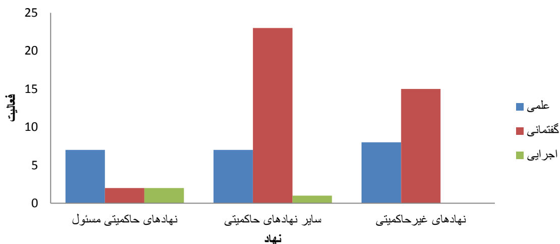
شکل ۲- نمودار کیفی مقایسه جنس فعالیت نهادها

برای تحلیل داده‌های جدول فوق و حصول تصویری کلی از فعالیت‌های صورت‌گرفته توسط نهادهای مختلف، می‌توان آنها را در سه دسته فعالیت‌های علمی ناظر به نظریه‌پردازی (مانند تولید مقالات و نظریات)، فعالیت‌های گفتمانی ناظر به فرهنگ‌سازی و جریان‌سازی (مانند برگزاری نشست‌ها و ارتباطات رسانه‌ای)، و فعالیت‌های اجرایی ناظر به سیاست‌گذاری یا پیاده‌سازی (مانند تولید لوایح و قوانین یا تأسیس رشته‌های دانشگاهی) تقسیم‌بندی و در نمودار زیر مقایسه نمود. البته باید توجه داشت که اموری از قبیل برگزاری همایش‌ها یا انتشار کتاب‌ها، دارای هر دو وجه علمی-گفتمانی بوده و همچنین وزن فعالیت‌ها متفاوت می‌باشد که این نکته ما را ناگزیر از نوعی ارزش‌گذاری کیفی می‌کند.